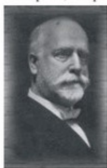
Рувим Арчер Торрей (1856-1928) был и евангелистом, и учителем Библии. Долго трудясь с Д.Л.Мули, он стал очень известен в течение путешествий по миру с проповедью в 1902 и 1921 годах. Его проповеди в Уэльсе в 1902 году были отмечены как одна из причин Уэльского пробуждения в начале 1900-ых. Он был первым руководителем Библейского Института Мули и написал многочисленные богословские книги и книги о посвящении.

И для каждого человека, который не верит, но хотел бы верить, открыт тот же путь!